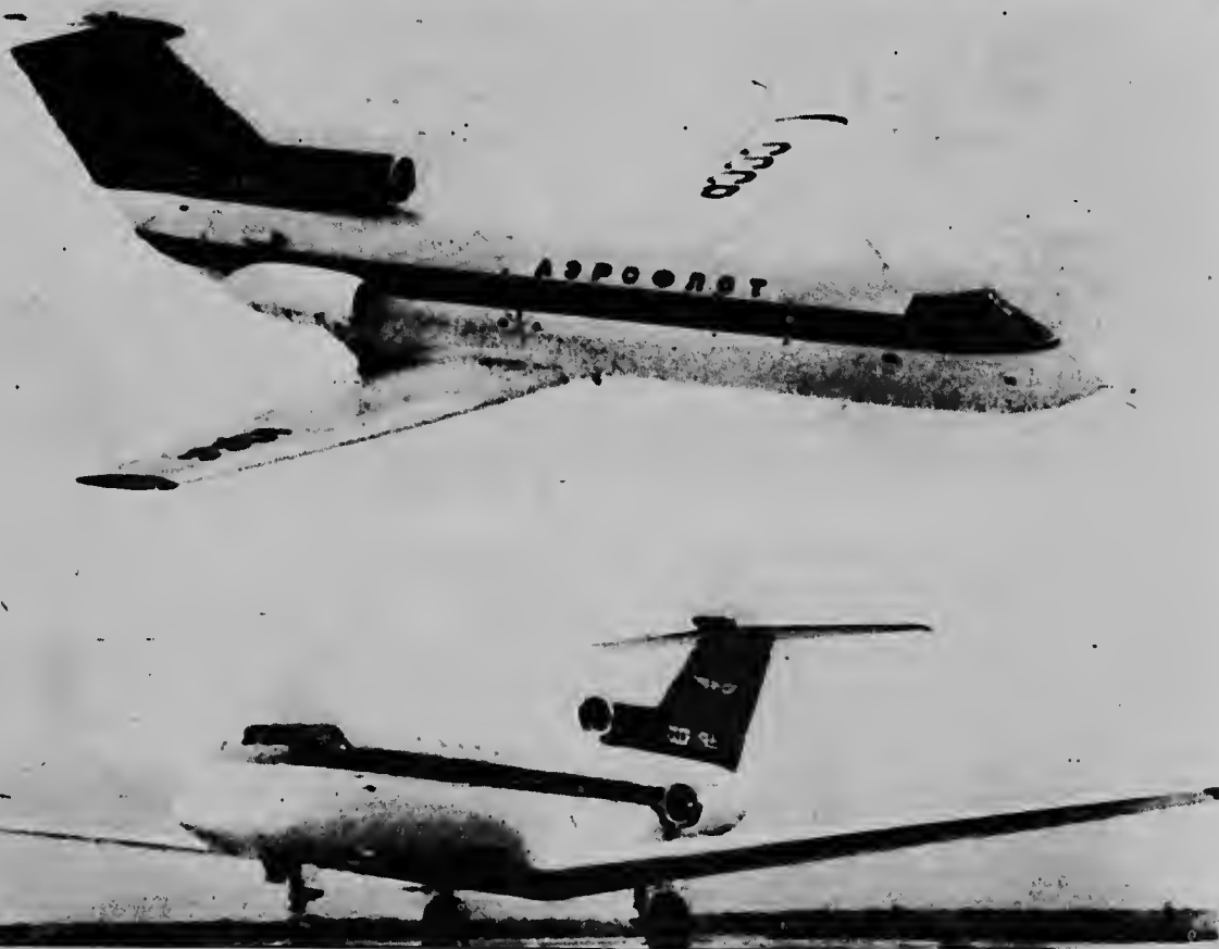
El avion Tri-jet sovietico nobo pa transporte de pasahero a ser exhibi recientemente y a cuminsa bula en Rusia. Nombre de el avion ta YAK-40 y ta un diseño de Alexander Yakovlev. El avion por transporta 24 pasahero y tin un velocidad de 750 kilometer por ora.